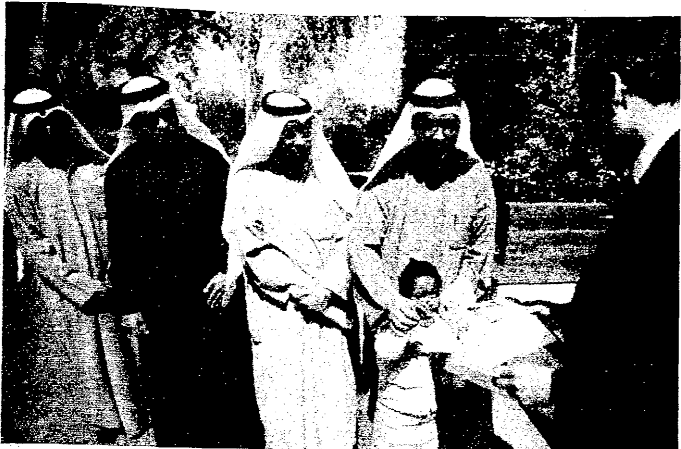
السيكرير البريطاني في الكويت جراهام بريس يتسلم مذكرة من وفد كويتي تطلب بالعمل على حل قضية القنصلين

قالت وكالة الانباء العراقية الرسمية في تقرير لها ان 2945 خبيرا تفتيشية ولذين 2099 موقع في العراق منذ بدء اعمال اللجنة الخاصة التابع لجيش الامن الدولي في العراق، حتى الثامن عشر من شهر شباط (فبراير) الماضي. واعترفت الوكالة ان هذه الارقام تدل على مقدار تعاون الحكومة العراقية معجان التفتيش، وعدم ثقة ما كان يصدر عن اللجنة الخاصة من اراءات وتصريحات بعيدة عن الحال. وقال التقرير ان 699 خبيرا زاروا 464 موقعا كيمياويا، فيما زار 629 خبيرا نفس الموقع في العراق منذ بدء 681 خبيرا زاروا مواقع الصواريخ، وكانت حصيلة خبراء السلاح النووي البالغ عددهم 611 خبيرا 556 موقعا حتى يوم 18 من شهر شباط (فبراير) الماضي. وقال التقرير لوكالة الانباء العراقية عن تقرير صادره الرقابة الوطنية العراقية ان الوكالة الدولية للسلامة